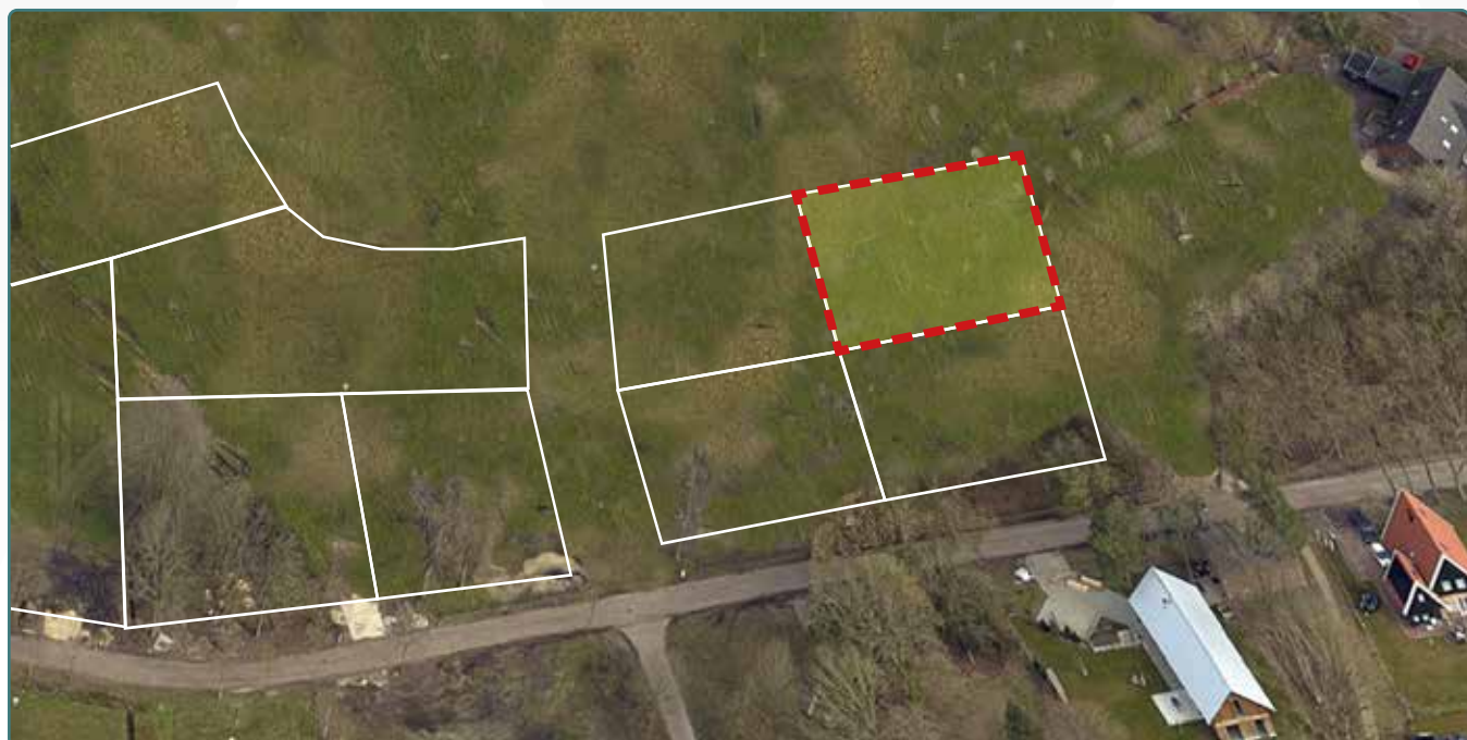
Kavel 156 vanuit de lucht