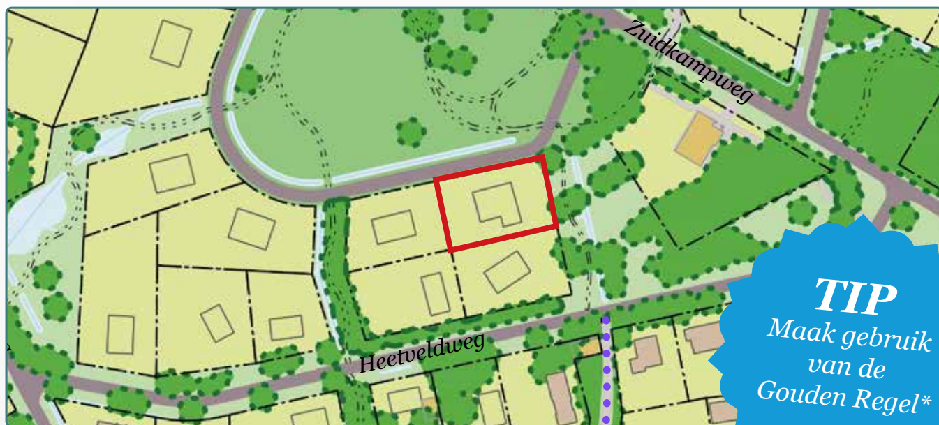
Situatietekening kavel 156